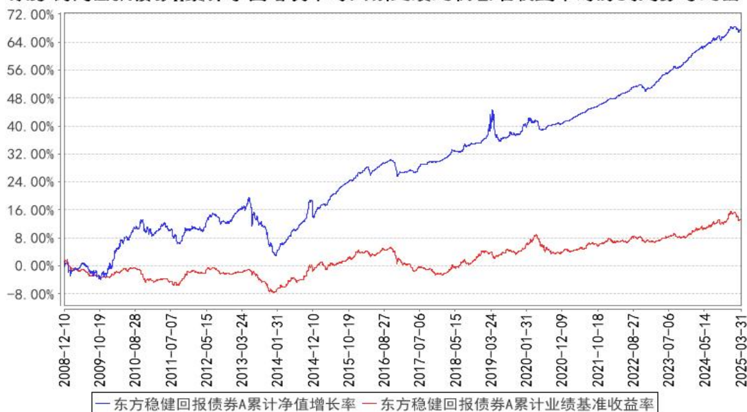
东方稳健回报债券A累计净值增长率与同期业绩比较基准收益率的历史走势对比图