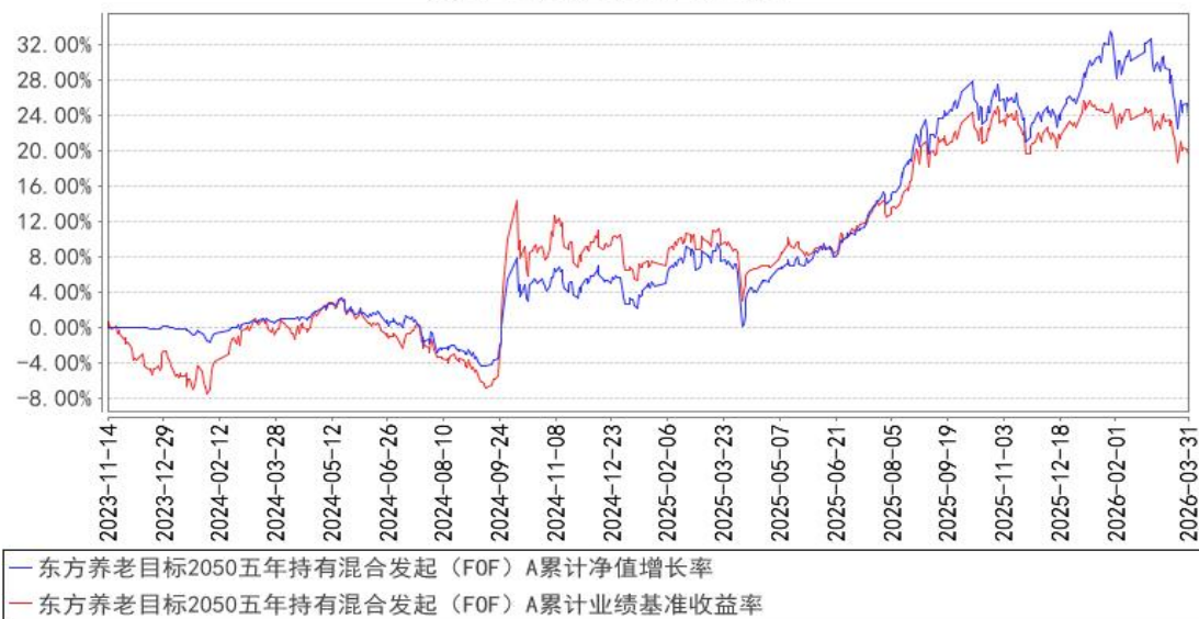
东方养老目标2050五年持有混合发起 (FOF) A累计净值增长率与同期业绩比较基准收益率的历史走势对比图