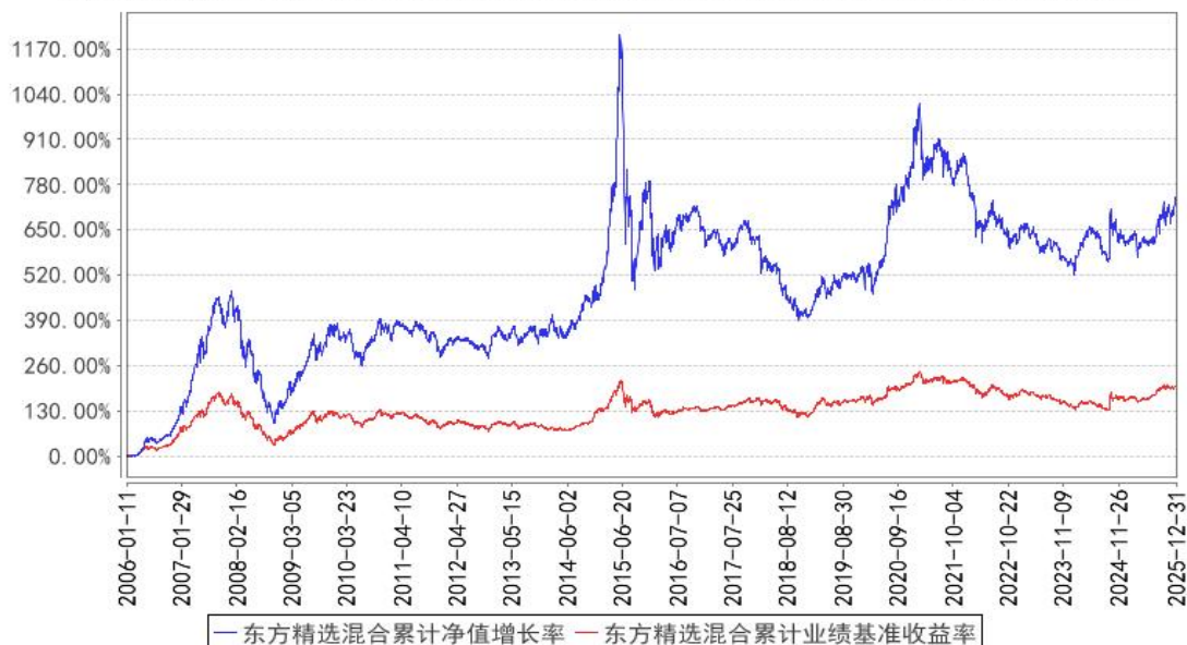
东方精选混合累计净值增长率与同期业绩比较基准收益率的历史走势对比图