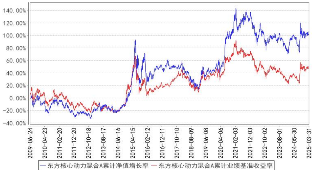
东方核心动力混合A累计净值增长率与同期业绩比较基准收益率的历史走势对比图