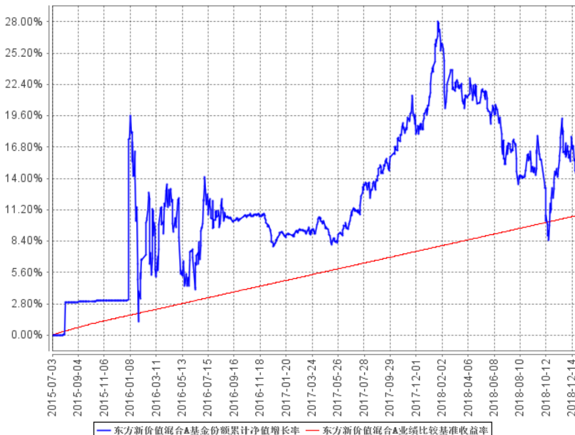
东方新价值混合A基金份额累计净值增长率与同期业绩比较基准收益率的历史走势对比图