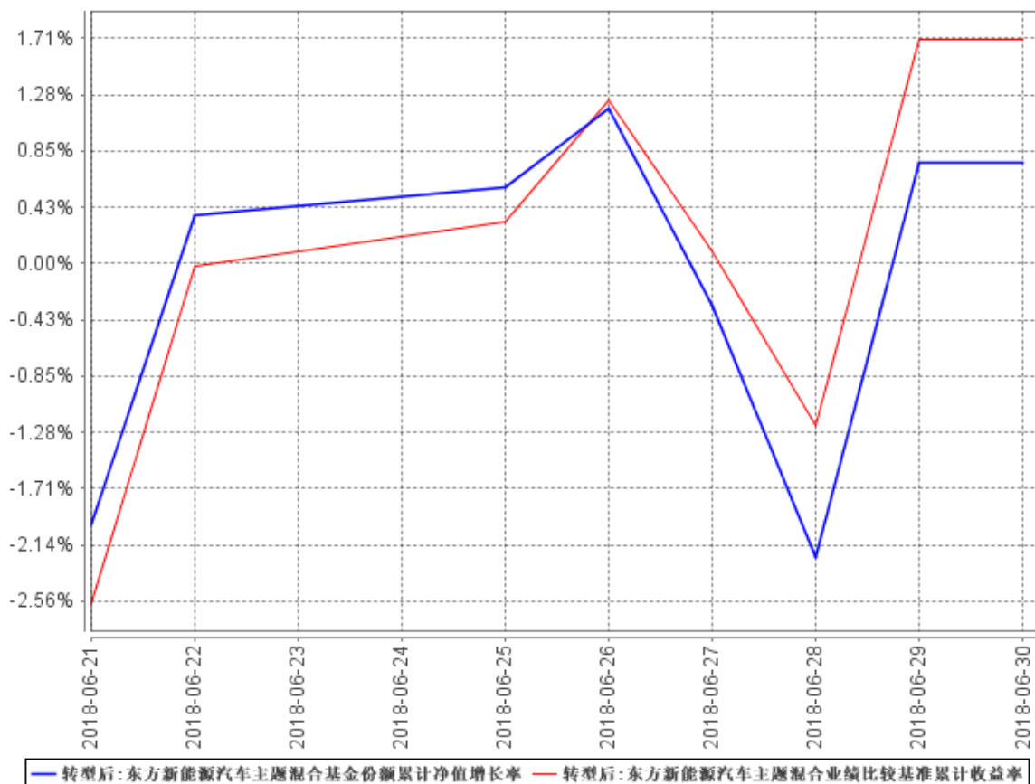
东方新能源汽车主题混合基金份额累计净值增长率与同期业绩比较基准收益率的历史走势对比图

注：本基金于 2018 年 6 月 21 日转型，截至报告期末，转型后基金合同生效不满六个月，仍处于建仓期。